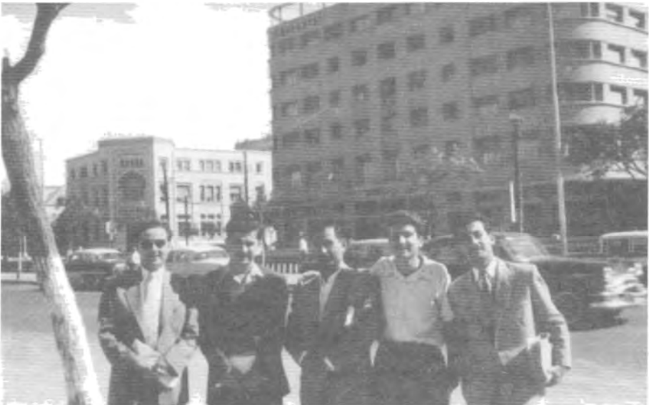
هاوینی ۱۹۵۵ دیمه‌شق