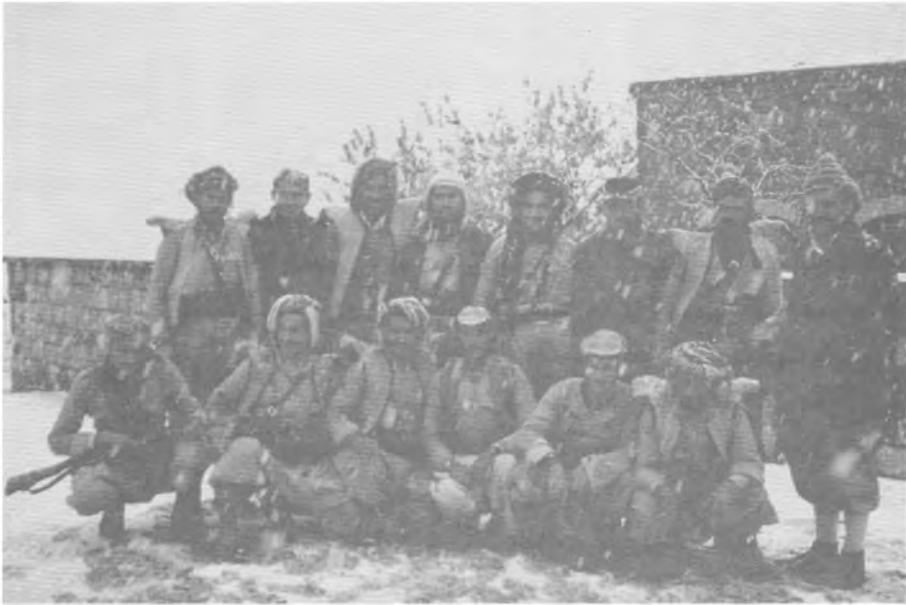
کومه‌تیک سه‌رکرده‌ی شورش و چهند بنشمه‌گه‌یه‌ک، زستانی ۱۹۶۳