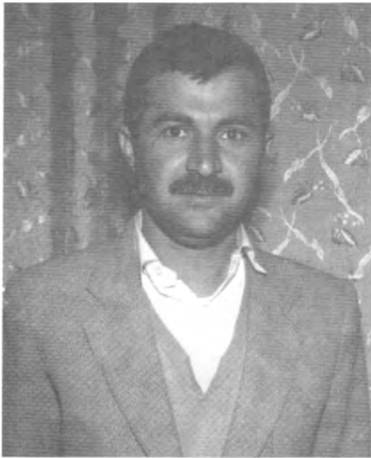
سهره‌تای کاملبونی زیان