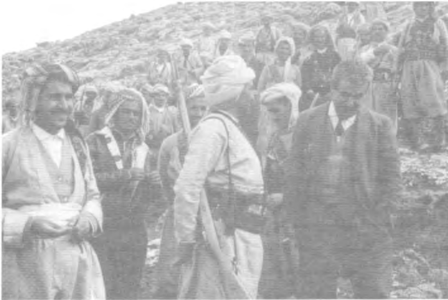
کانی ماران له گه‌ل بارزانی و هه‌ژار موکریانی - مارتی ۱۹۶۳