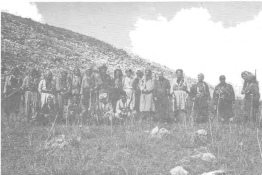
له گه‌ل د-که مال فواد و بۆلی یتشمه‌رگه، مارتی ۱۹۶۳