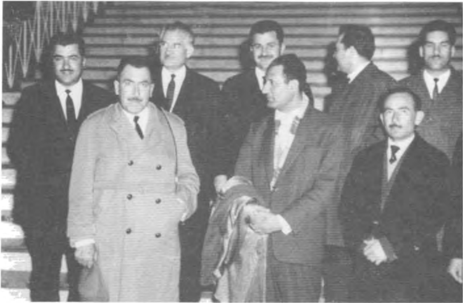
له گهَل چهند سهرکردايه تيه کی پارتي له تاران ۱۹۶۴