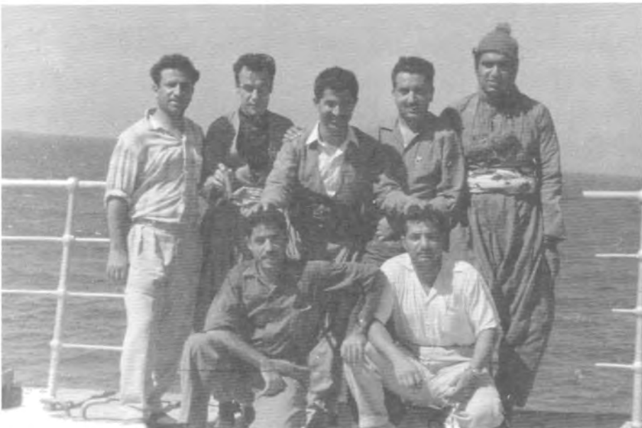
فېستىۋالى لاوان لە مۇسكۆ