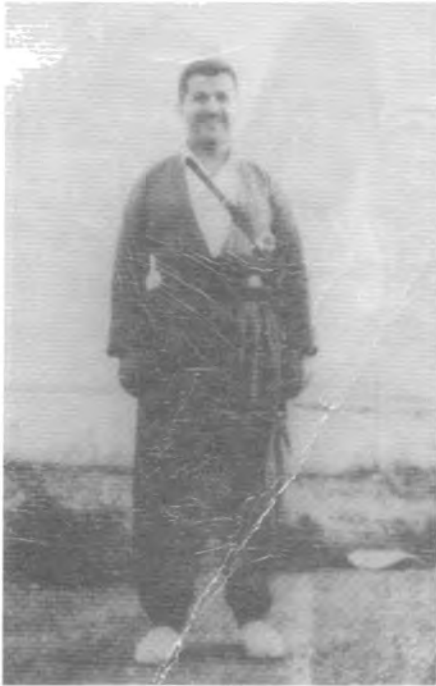
سهره‌تای سییه‌کانی ژیان