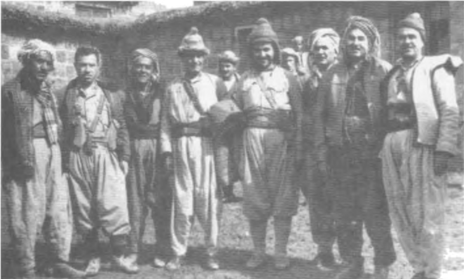
له‌گه‌ل کۆمه‌لێک ینشمه‌رگه سه‌ره‌تای ۱۹۶۳