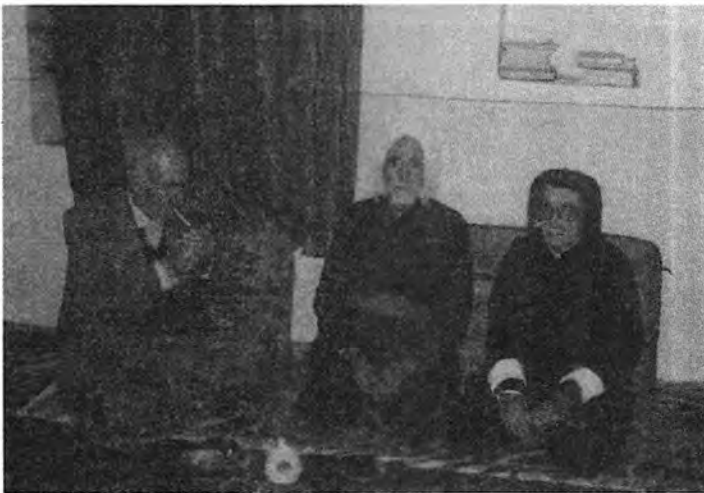
له راسته‌وه: ۱. حه‌قیقی ۲. ناوات ۳. هه‌زار سالی ۱۳۶۴ی هه‌تاوی - بۆکان