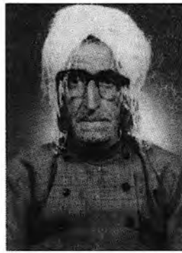
سالی ۱۳۵۰ ای هه تاوی