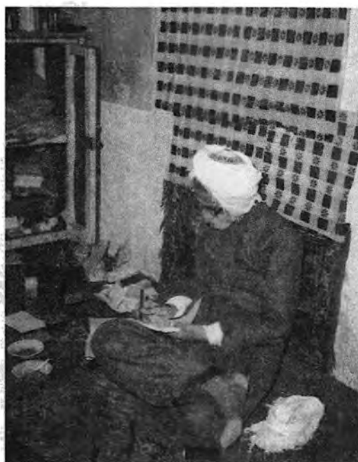
ناوات (سالی ۱۳۵۵ ای هه تاوی - قاقلاوا)