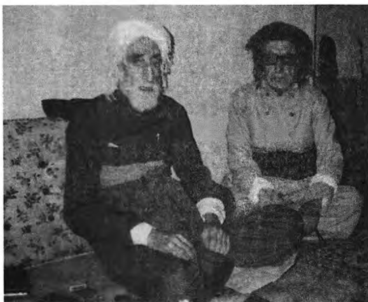
له راسته‌وه: ۱. حه‌قیقی ۲. ناوات سالی ۱۳۶۸ ی هه‌تاوی - سه‌قز