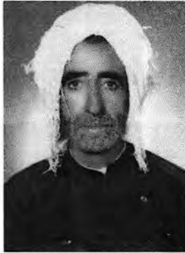
سالی ۱۳۳۵ ای هه تاوی