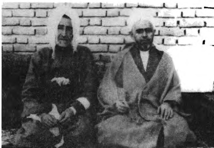
له راسته وه: ۱. حاجی به حمان ناغا موهته دی ۲. ناوات سالی ۱۳۴۴ ای هه تاوی - بوکان