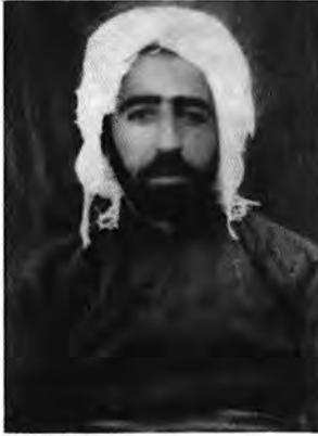
سالی ۱۳۱۲ ای هه تاوی