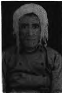
سالی ۱۳۵۳ ای هه تاوی