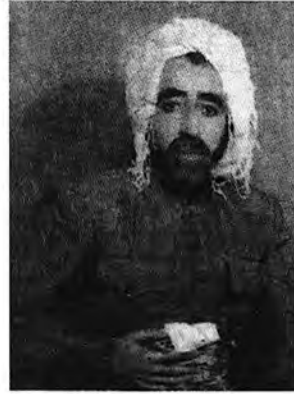
سالی ۱۳۰۳ ای هه تاوی