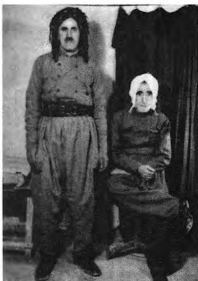
له راسته‌وه: ۱. ناوات ۲. کاک همه‌ساله‌ی خاله‌مینه سالی ۱۳۵۷ی هه‌تاوی - بوکان